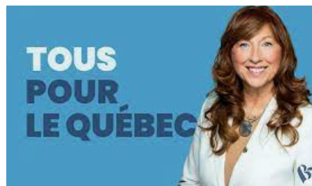
Caroline Desbiens, Députée, Beauport-Côte-de-Beaupré-Île D'Orléans-Charlevoix